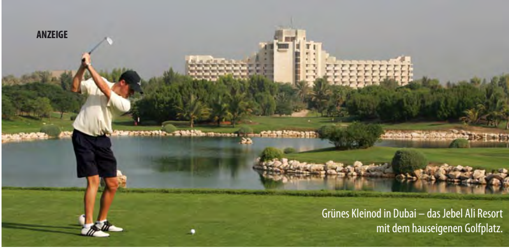
Grünes Kleinod in Dubai – das Jebel Ali Resort mit dem hauseigenen Golfplatz.